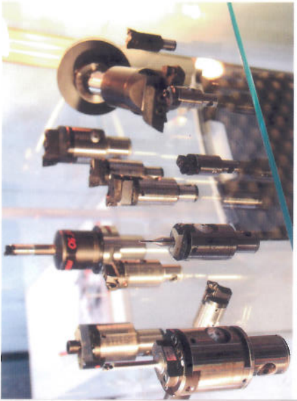
Cerca de 400 empresas de pequeno e médio portes detêm quase 9% das exportações mundiais do setor